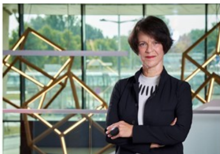
Foto: "Mag. Claudia Strohmaier (Berufsprüfungssprecherin Unternehmensberatung in der Fachgruppe UBIT Wien) "